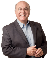
Arnaldo Jardim é Secretário de Agricultura e Abatecimento do Estado de São Paulo

Foram nos grandes oceanos que surgiram os primeiros seres vivos, e é por meio dela que os seres humanos obtêm sua sobrevivência... Cuidar dos recursos hídricos é manter a produtividade do solo, e assim o setor agropecuario pugna.