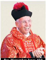
Por Monsenhor Jonas Abib

A cura física e espiritual de que necessitamos está na adoração, está em nos aproximarmos do trono da graça com o propósito de sermos atingidos pela divindade de Nosso Senhor Jesus Cristo.