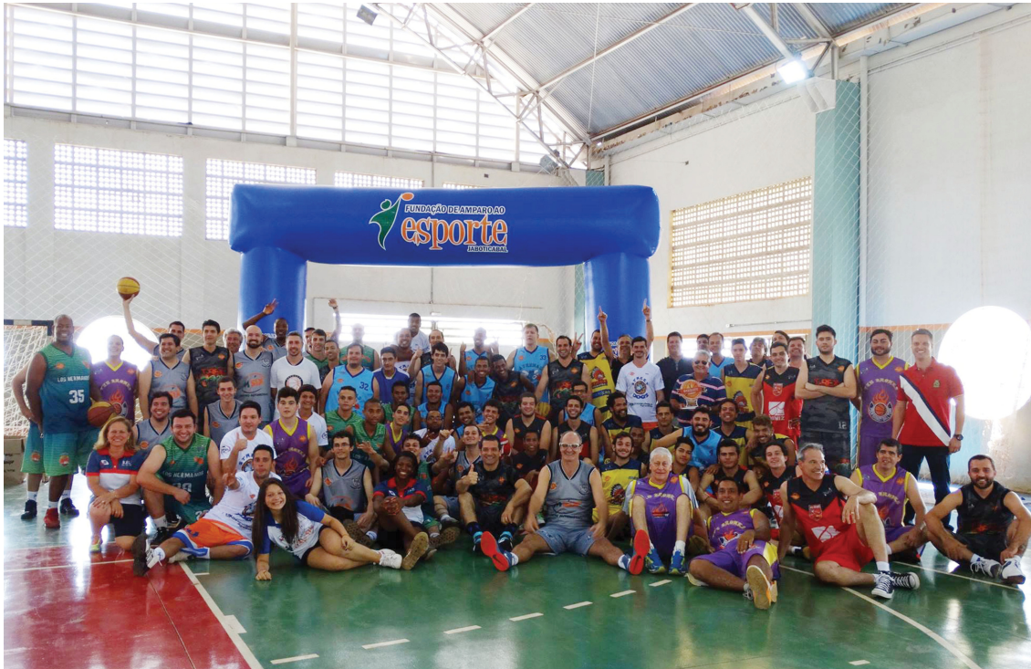
EQUIPES DE BASQUETE MASCULINO E FEMININO DA F.A.E./JABOTICABAL EM MAIS UMA TEMPORADA ENTRE OS MELHORES DA LIGA DE BASQUETE/RIBEIRÃO PRETO, DEMONSTRANDO A FORÇA DA MODALIDADE EM JABOTICABAL

ternativa, Óticas Carol, Sotelo Amendoin, Construtora The Casa, Disk Água Lindóya, 3g Fitness - Treinamento Funcional e Personalizado, Msix Centro Automotivo, Lima Contabilidade, Jaboticabal Uniformes, Sônia Buffet, Colégio Difere, Medtur, Oxiquímica, Quinta das Flores Buffet, Barreto Comércio de Materiais para Construção e Óticas Diniz. Agradecimentos pela confiança e parceria.