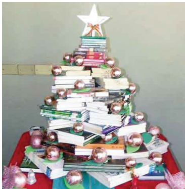
mais informações sobre a Biblioteca Municipal e seu horário de funcionamento, o telefone de contato é (16) 3202-1671.

Cada um foi presenteado com dois livros. Para