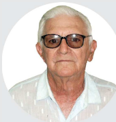
PEDACINHOS DE LUZ HELDER F. SIMURRO

O tempo marcou saudades. A vida trouxe para o hoje, lembranças que ficaram marcadas no rol das sucessivas etapas, no mundo eterno do espírito. Os sonhos são eras de es-