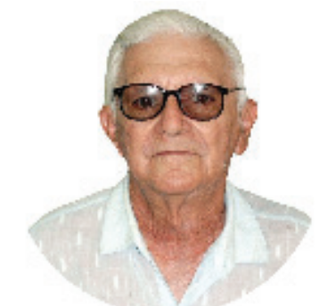
PEDACINHOS DE LUZ HELDER F. SIMURRO

Programa Corrente do Bem, às quartas e sextas feiras, às 08:00 pela Gazeta FM 107,9.