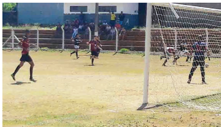
A entrada é gratuita. Mais informações na secretaria do Ginásio de Esportes ou pelo telefone (16)3202-0547.