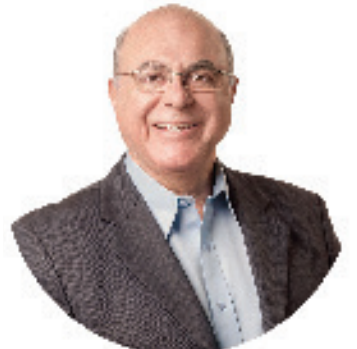
Arnaldo Jardim é Secretário de Agricultura e Abastecimento do Estado de São Paulo

reformas, ao invés de só ficarem debruçados em CPIs? Por que não realmente discutem e votam reais necessidades do povo brasileiro, ao invés de ficarem preocupados apenas com a próxima reeleição? Vejam a Reforma Tributária, entra Governo, sai Governo e nada.... O diagnóstico está correto: O Brasil está doente, está com “paralisia infantil”, o tratamento para essa doença brasileira seria resolvido através de três remédios: VONTADE POLÍTICA, VERGONHA NA CARA e AMOR AO BRASIL.