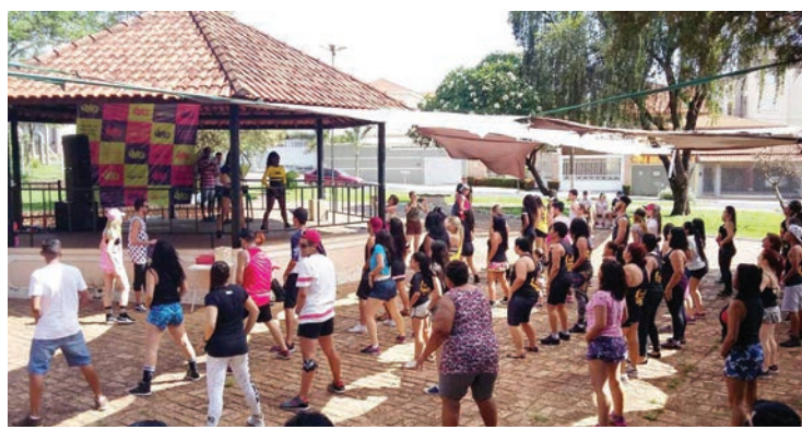
já que uma aula inclui coreografias de diferentes estilos musicais com movimentos modernos e de fácil assimilação.

Fitdance – É uma nova modalidade de exercício que está fazendo sucesso entre famosas pelo Brasil. O Fitdance promete, além de gastar calorias e divertir,