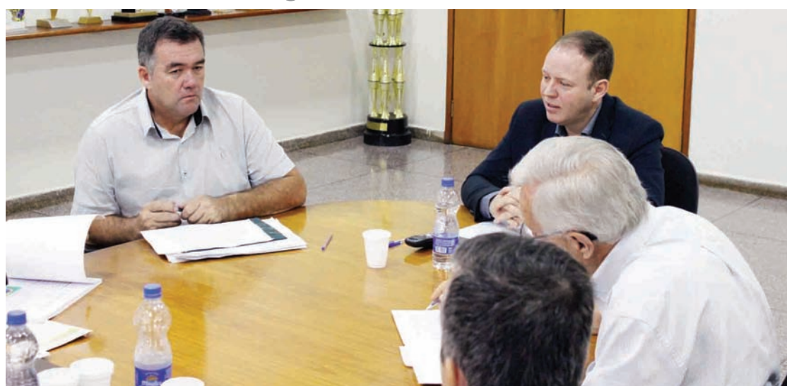
1ª reunião da Comissão estabelece metas e prazos

A força-tarefa é formada por diferentes secretarias, como Obras, Planejamento, Governo,