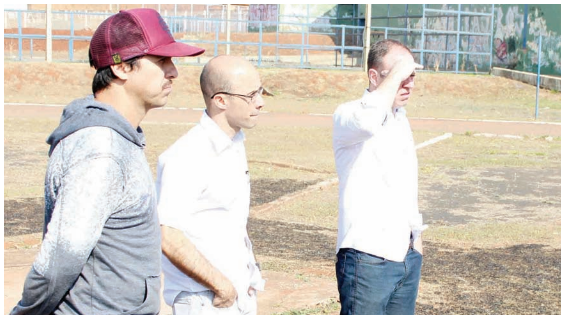
Prefeito confere andamento de obras no Mônaco