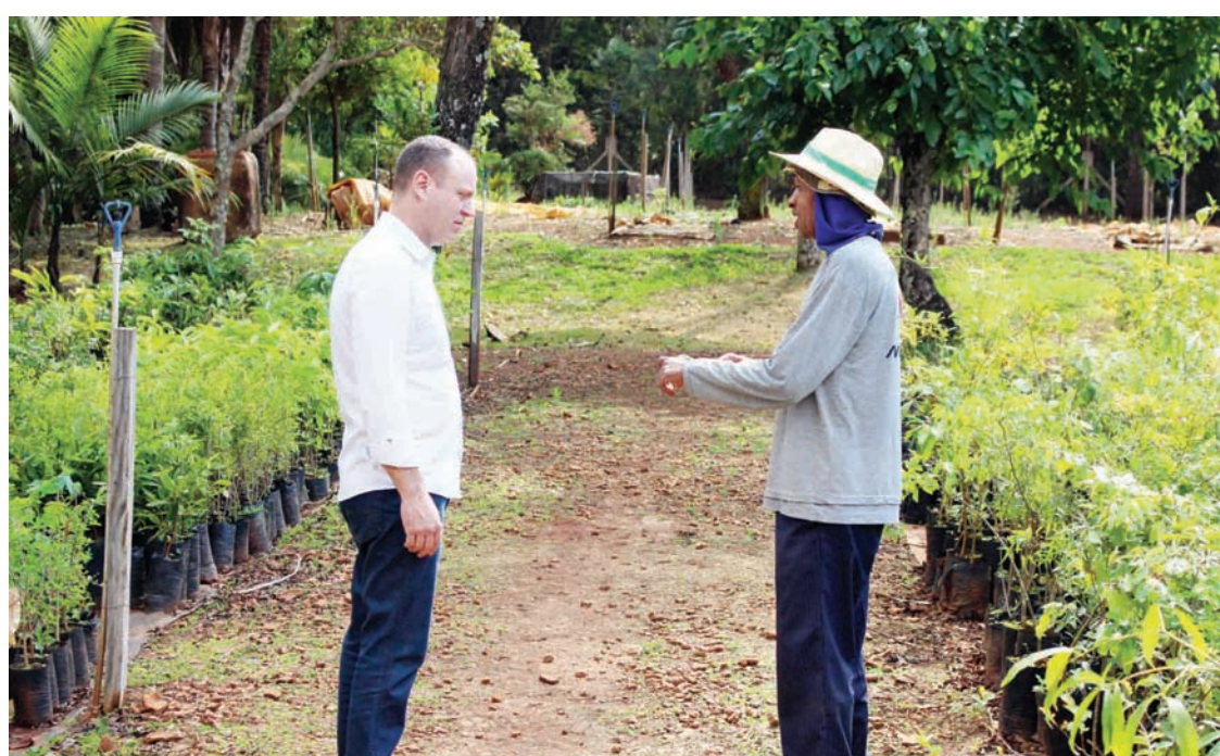
Prefeito ouve as necessidades dos funcionários