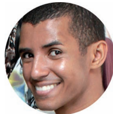
Upl - Por Cichinho Maquiador, Designer de Moda, Scouter

ções, o telefone de contato do Departamento de Cultura é (16) 3202-8323.