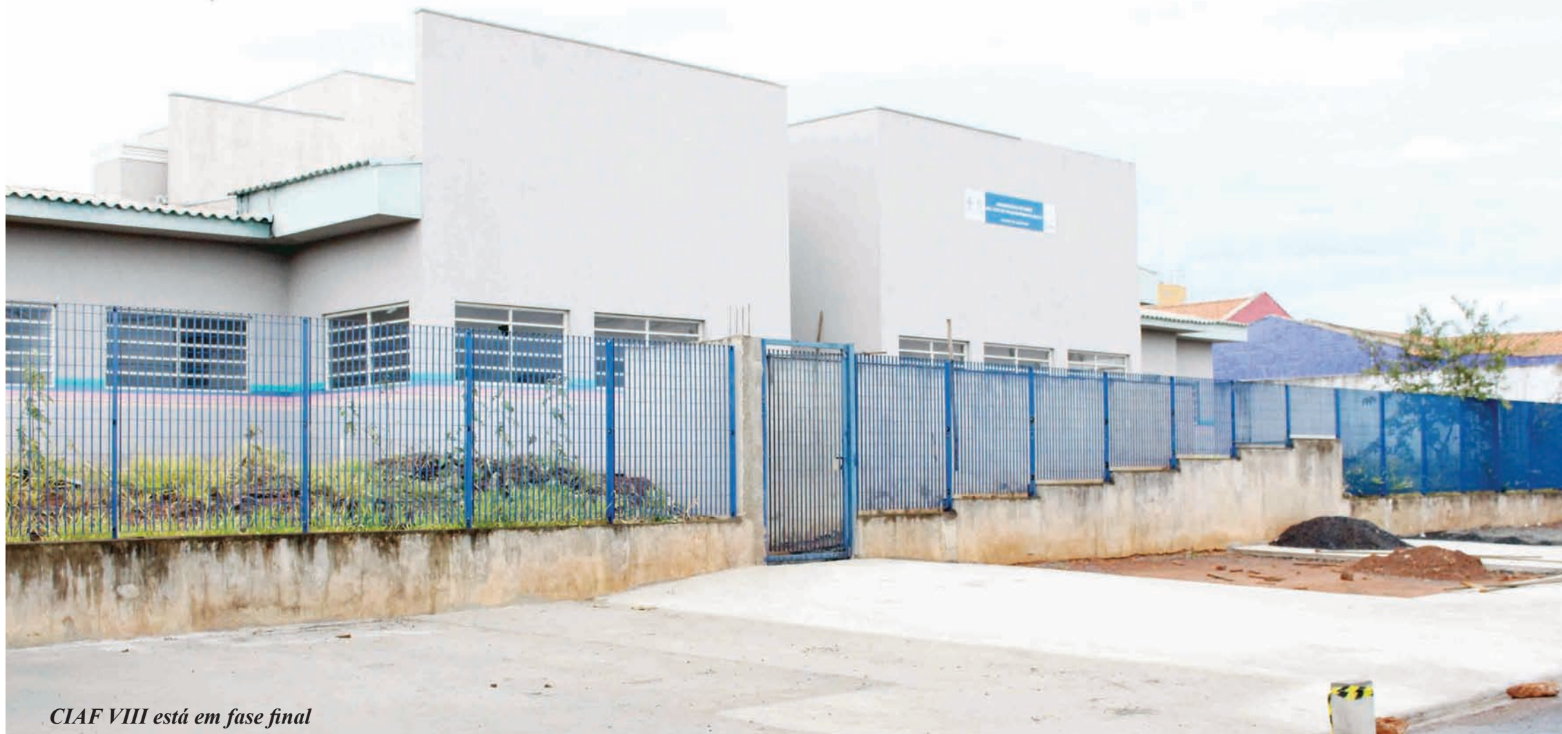
CIAF VIII está em fase final