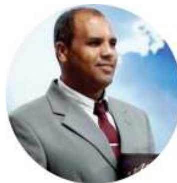
Pr. Anastácio Martins

de superação. Ele foi atropelado no dia 24 de junho, na Rodovia Faria Lima, sentido Bebedouro. Ficou por horas dentro de uma vala até ser resgatado pelos bombeiros. Passou vários dias internado, quase precisou de cirurgia, mas se recuperou bem e, há duas semanas, teve alta. Hoje está acolhido no Canil Municipal e à espera de uma nova família.