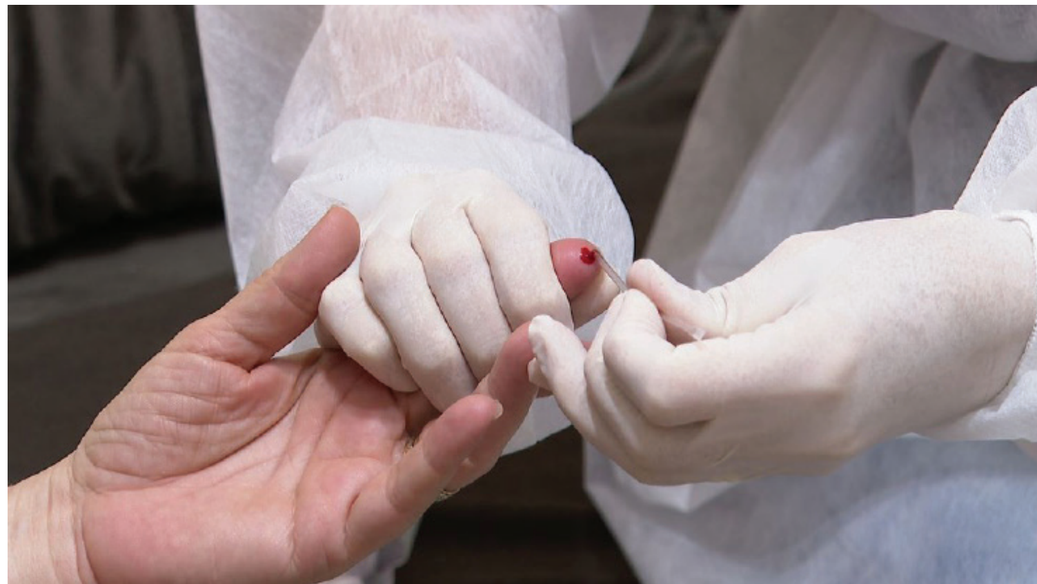
Teste rápido da Covid-19 em Jaboticabal (SP)

Em 28 dias, 267 moradores foram infectados pela doença. De março até agora, cidade soma 534 positivos e 30 mortes, segundo a Secretaria Municipal da Saúde