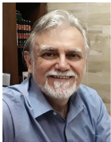
P/ João Martins Neto

Artigos e Colunas assinados não representam necessariamente a nossa opinião, sendo de responsabilidade de seus autores.