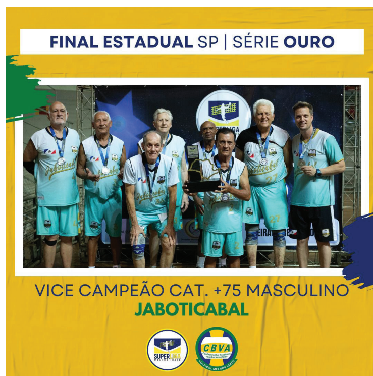
FINAL ESTADUAL SP | SÉRIE OURO